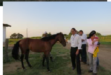
Visitas aos setores de campo