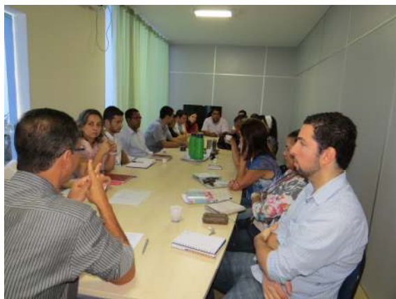
Reunião com gestores e servidores técnico-administrativos