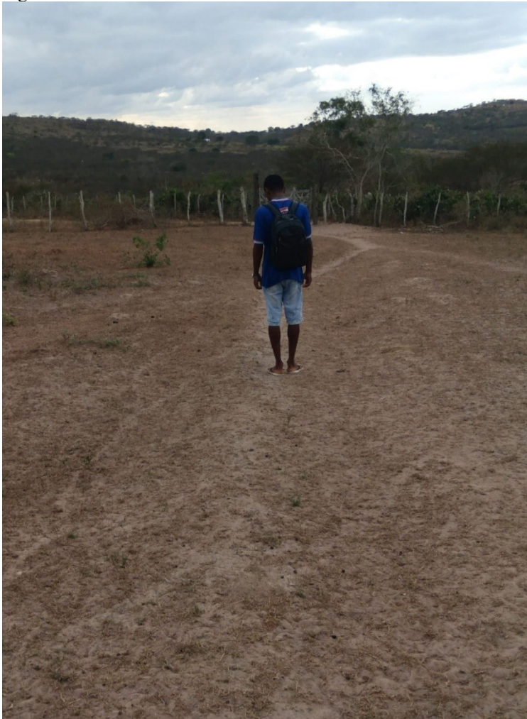
Figura 06: Juliel no caminho

“... Quando estou longe das salas eu ajudo meu pai na lida com o campo, trabalho também com doma racional de equinos. Meu maior sonho é se formar em Medicina Veterinária...”