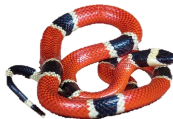
Coral-verdadeira ( Micrurus ) 7%