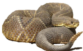
Cascavel ( Crotalus ) 72%