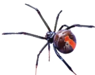
Viúva-negra ( Latrodectus )