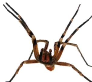
Armadeira ( Phoneutria )