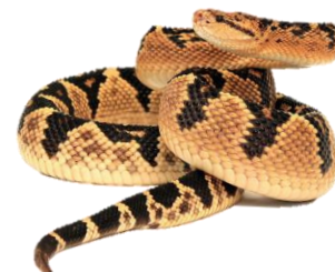
Surucucu ( Lachesis ) 1%

Todas as aranhas são peçonhentas e podem causar acidentes, mas no Brasil, três aranhas têm importância médica: