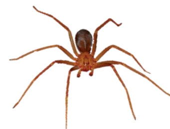
Aranha-marrom ( Loxosceles )

Lixo e entulho jogado ao longo da rodovia servem de moradia para os escorpiões. No Brasil, várias espécies de escorpiões causam acidentes, mas aqueles do gênero Tityus são os únicos de importância médica.