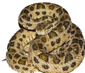
Jararaca ( Bothrops ) 19%