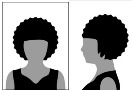
Figura 01 - Modelo de foto frontal