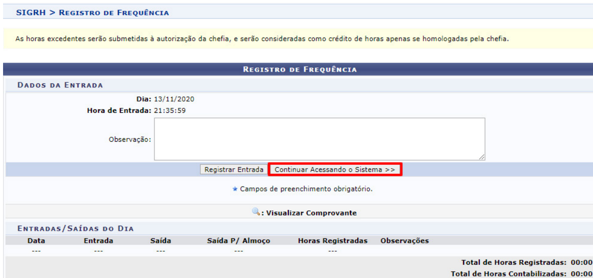
Figura 2 - Tela do SIGRH, após efetuar o login.