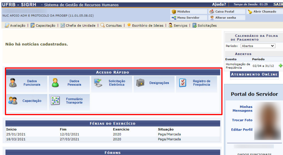
Figura 3 – Tela inicial do SIGRH

Após clicar em "Continuar acessando o sistema" , você terá acesso à tela inicial do Módulo SIGRH (menu servidor), conforme Figura 3 .