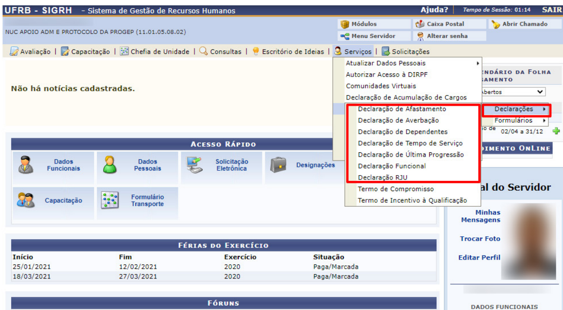
Figura 7 – Tela para Seleção do Tipo de Declaração.

Ao selecionar o tipo de declaração desejada, o SIGRH emitirá automaticamente a declaração para download conforme demonstrado na figura abaixo.