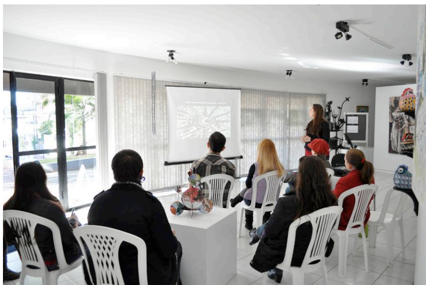
Figura 05 – Registro fotográfico da Oficina Cidade Adentro da Associação Adentro, na Galeria Municipal de Artes Dalme Marie Grando Rauen, Prefeitura Municipal de Chapecó, 28/05/2011.

E para finalizar o relato das ações desenvolvidas na Galeria Municipal de Arte, as seis oficinas realizadas durante o ano de 2011 também privilegiaram o acesso ao contato com a Arte, os artistas selecionados ministraram durante o período das exposições mini-cursos que trabalhavam principalmente com os conceitos e influências a respeito das poéticas artísticas desenvolvidas e sobre técnicas artísticas contemporâneas. É o caso das oficinas que abordaram a fotografia digital, intervenção urbana e dinâmicas práticas, onde os participantes produziam arte e dialogavam com os próprios artistas a respeito do seu trabalho trocando experiências significativas. Segue registro de uma das oficinas realizadas: