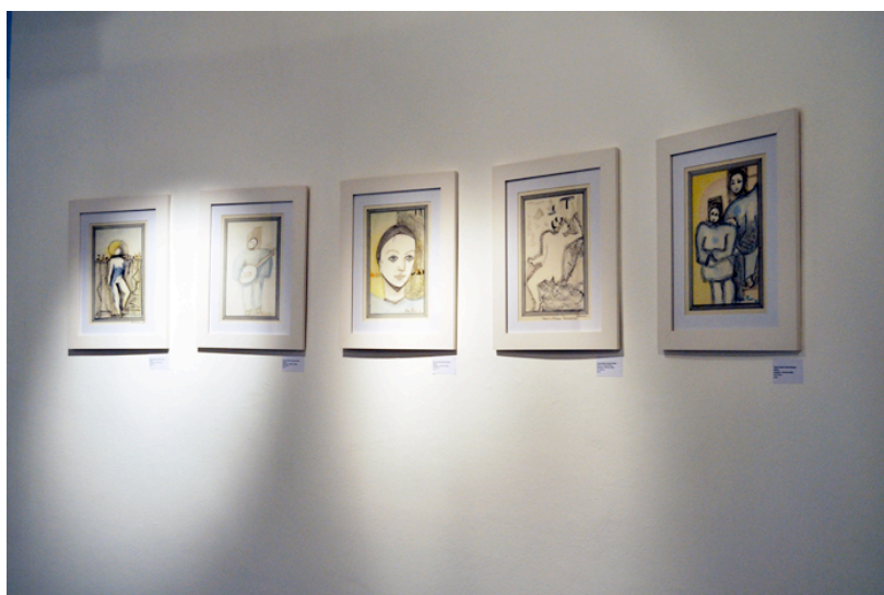
Figura 03 – Detalhe, Memorial Dalme Marie Grando Rauen , Galeria Municipal de Artes Dalme Marie Grando Rauen, Prefeitura Municipal de Chapecó, 2011.