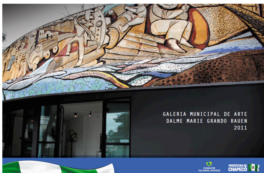
Figura 01 – Capa Catálogo-programa Galeria Municipal de Arte Dalme Marie Grandó Rauen , Prefeitura Municipal de Chapecó, 2011.