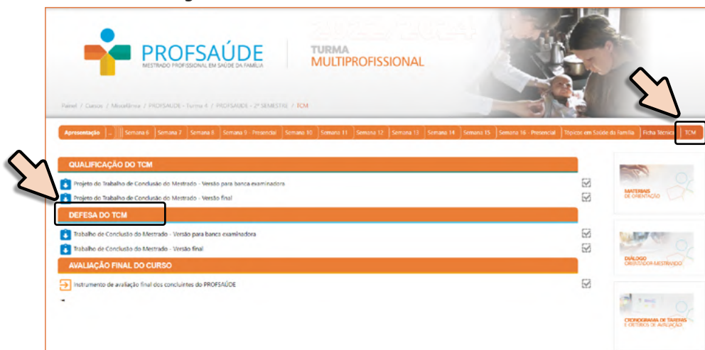
Figura 3 - Trabalho de Conclusão do Mestrado - moodle

No moodle , consta a aba denominada “TCM Qualificação e Defesa” e no espaço “Defesa do TCM” (Figura 3), deverão ser postadas tanto a versão para a banca examinadora quanto a versão final do Trabalho de Conclusão do Mestrado.