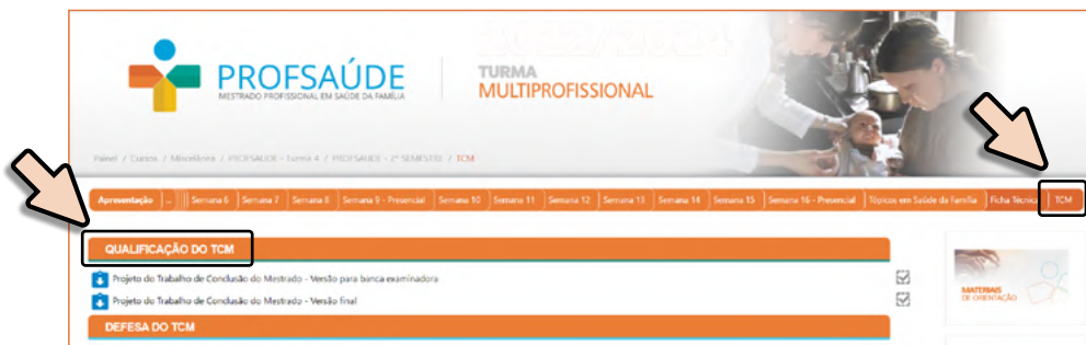
Figura 2 - Qualificação do Trabalho de Conclusão do Mestrado - moodle

No moodle , consta a aba denominada “TCM Qualificação e Defesa” e no espaço “Qualificação do TCM” (Figura 2), deverão ser postadas tanto a versão para a banca examinadora quanto a versão final do projeto do trabalho de conclusão do mestrado.