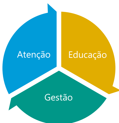
Gráfico 1 - Eixos Pedagógicos da Proposta Curricular do PROFSAÚDE

O trabalho pedagógico, no PROFSAÚDE, pressupõe que a aprendizagem é o centro do processo, respeitando a autonomia do(a) mestrando(a) e acolhendo a bagagem de conhecimentos e experiências que o(a) mestrando(a) traz de sua vivência profissional. O curso oportuniza situações de aprendizagem utilizando metodologias ativas, especialmente, problematizações. Seu desenho curricular contempla três eixos pedagógicos: Atenção , Educação e Gestão .