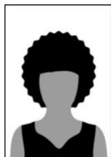
Figura 01 - Modelo de foto frontal