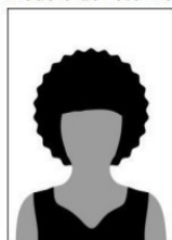
Figura 01 - Modelo de foto frontal