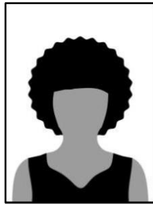
Figura 01 - Modelo de foto frontal