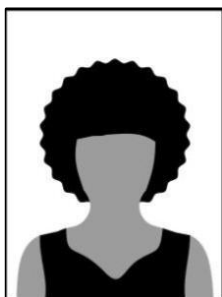
Figura 01 - Modelo de foto frontal