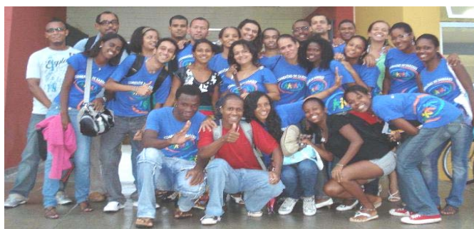
Estudantes do Conexões de Saberes /PPQ/PROPAAE

Protagonistas das "Rodas de Formação", metodologia baseada na concepção de horizontalidade das "rodas" de matriz Africana, promove o diálogo, o debate, a transigência e a exposição de idéias, opiniões, conteúdos e experiências de forma colaborativa e solidária desenvolvida pela PROPAAE, com base em epistemologia participativa, tendo como objetivo promover a implantação da Lei 10.639/03' que altera a Lei nº 9.394/96 estabelecendo as diretrizes e bases da educação nacional, para incluir no currículo oficial da Rede de Ensino a obrigatoriedade da temática "História e Cultura Afro-Brasileira", e dá outras providências. Autores dos livros 'Caminhadas' e 'Grandes Temas'-SECAD/MEC.